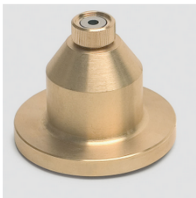
(coppa ford con ugello) Ford cup with nozzle

Utilizzabili in vari settori industriali e nei laboratori di ricerca e controllo. Particolarmente utili all'industria ceramica, per la rilevazione della viscosità degli smalti e delle barbotine.